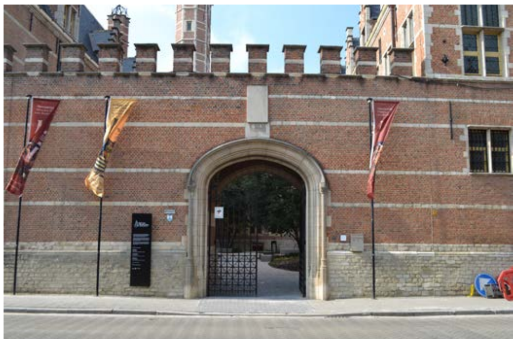
Ingang Frederik de Merodestraat

Deze route duurt ongeveer 5 minuten. Ik sla rechtsaf in de Van Busleydenstraat. Ik kom uit in de Jodenstraat. Hier ga ik naar links. Ik kom uit in de Frederik de Merodestraat. Hier sla ik rechtsaf. Ik vind het museum aan mijn rechterkant.