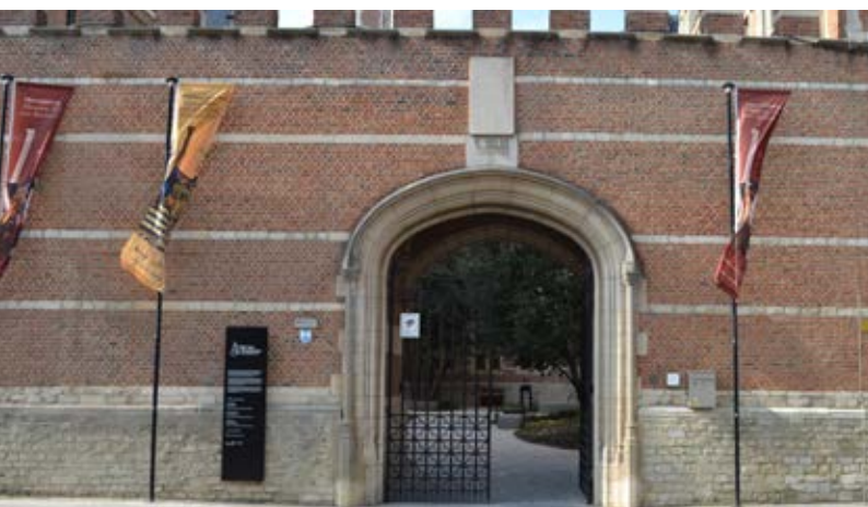
Ingang Frederik de Merodestraat

Ik zie de zij-ingang van het museum als ik aan de bushalte sta.